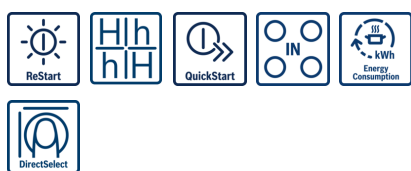
Table induction pour cuisiner vite, en toute sécurité, avec peu d'énergie